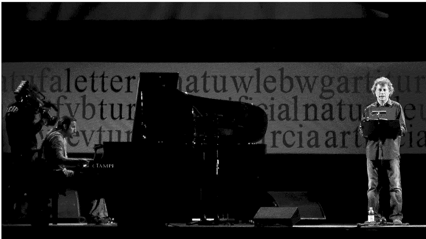
IL SUCCESSO Alessandro Baricco, 57 anni, al Festival delle Letterature a Roma. Qui sopra, la copertina del nuovo romanzo