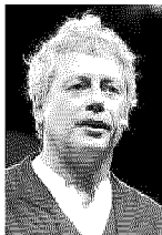
Ranieri ▶ pag. 14

L'altrove, la mattia e il "cagarsi sotto": scusi, Baricco, ma come scrive?