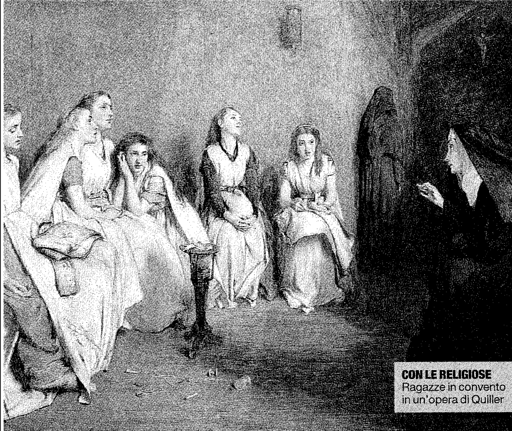
CON LE RELIGIOSE Ragazze in convento in un'opera di Quiller